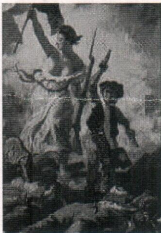
Fig. 1 Eugène Delacroix, La liberté guidant le peuple. L'enfant aux pistolets (détail). Musée du Louvre.

Q6. Comment le tableau "La Liberté guidant le peuple" de Delacroix illustre-t-il l'esprit des Trois Glorieuses ?